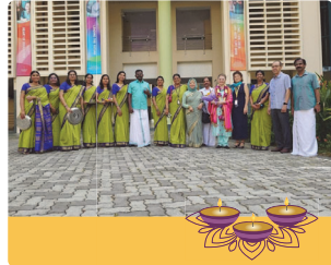
தீபாவளி கொண்டாட்டம் 2024