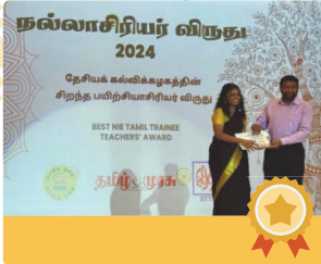
சிறந்த மாணவ ஆசிரியர் விருதை வென்றவர், 2024