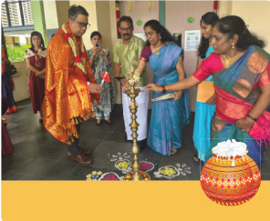
பொங்கல் கொண்டாட்டம் 2024