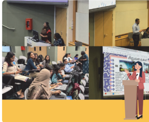
வாராந்திர மாணவ ஆசிரியர் கருத்தரங்க நிகழ்வில் கல்வியாளர்களுடனான சந்திப்பும் கலந்துரையாடலும், 2024