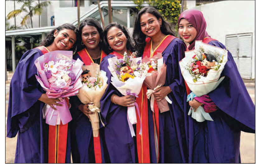
உற்சாகத்துடன் தமிழ் கற்பிக்கத் தயாராகியுள்ள இளம் தமிழாசிரியர்கள்.

பட்டம் பெற்றவர்களை வாழ்த்திப் பேசிய அமைச்சர் சான் சிங், இளம் ஆசிரியர்